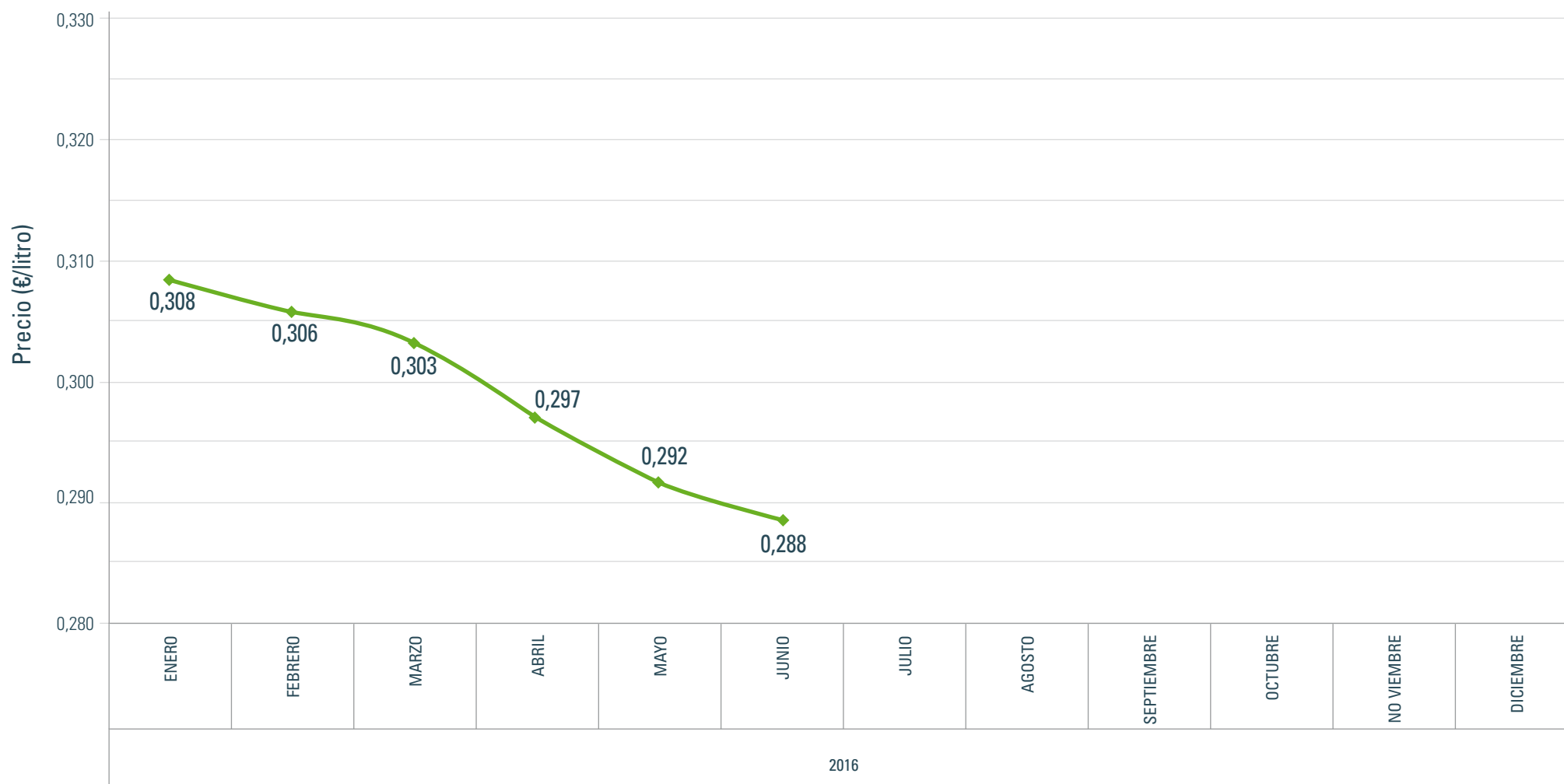
Evolución del precio