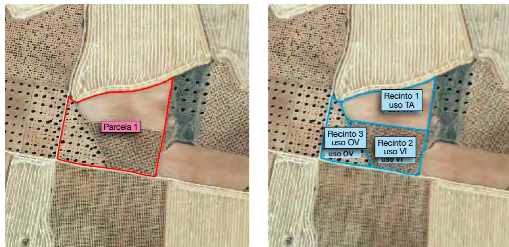
Codificación de usos: VI = Viñedo; OV = Olivar; TA = Tierra Arable

El SIGPAC delimita los distintos usos dentro de cada parcela catastral mediante recintos SIGPAC a los que asigna una referencia o código identificativo único, un uso determinado, una superficie, un régimen de explotación (secano o regadío), un coeficiente de admisibilidad en el caso de recintos de pasto, una región del régimen de Pago Básico y otro tipo de información relevante para las ayudas de la PAC.