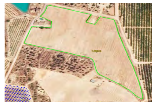
CAMPAÑA 2016 Frutales → Tierra Arable

3. Es necesario repasar la situación de sus parcelas en el SIGPAC todos los años y si observa que algún recinto no está correctamente delimitado o que su uso es incorrecto, debe ponerlo en conocimiento de su Comunidad Autónoma, utilizando el procedimiento que tenga habilitado con este fin.