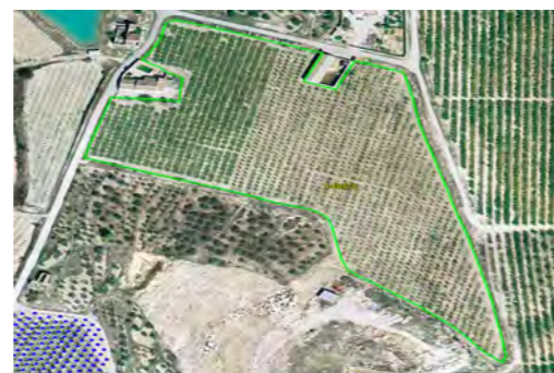
CAMPAÑA 2015 Frutales

2. El uso asignado a su recinto debe ser el que exista en la actualidad. Si ha cambiado el uso que venía declarando en algún recinto, debe notificarlo a su administración lo antes posible.